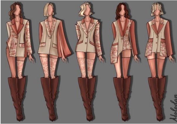
Рис. 4. Ескізи колекції моделей жакетів жіночих «Painted» з використанням принту