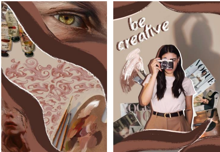
Рис. 3. Колаж колекції: а – джерела натхнення; б – споживача

В результаті детального аналізу творчого джерела, споживача, виробів різних форм та крою розроблено колекцію жіночих жакетів «Painted» (рис. 4). Моделі вирізняються своїм кольоровим оформленням, акцентними деталями у вигляді рукавів та асиметрії, але головним виразним елементом є принт, що розміщений на різних частинах жакетів.