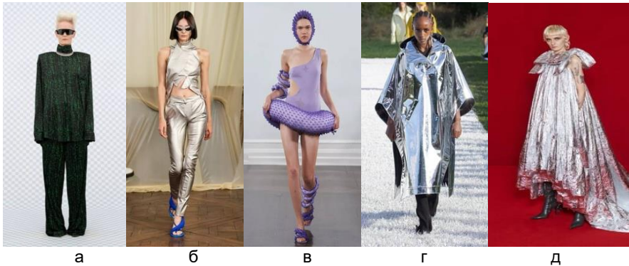
Рис. 1. Моделі сучасних дизайнерів у стилі футуризму:

Основною рисою футуристичних колекцій сьогодення є новаторський підхід, використання інноваційних матеріалів, переважання у моделях або аксесуарах ефекту «рідкого металу» або просто блискучих елементів одягу. Важливим елементом футуризму або модернізму, як його ще прийнято називати, також є зламані геометричні або навпаки обтічні аеродинамічні форми [3]. Аналіз сучасних тенденцій моди показав, що можна виділити декілька основних трендів в межах напрямку футуризму (рис.1). Дизайнери віддають перевагу «матеріалам майбутнього», на чолі яких пластик, вініл і навіть фольга (рис.1,г,д). Яскраві неонові кольори — ще один маркер футуристичного стилю (рис.1,в): наприклад, відтинки лілового, інопланетний зелений тощо (рис. 1,а.)