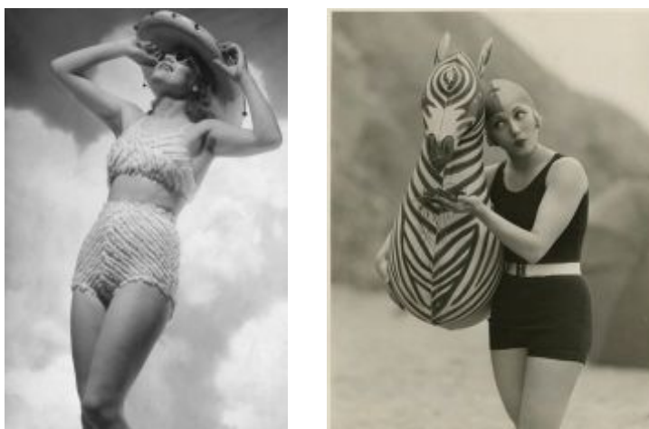
Рис. 4. Одяг для купання 1930-х років:

У 1940-х роках жінки все більше ставилися до купальних костюмів як до засобу кокетства і спокушання, надягали до нього модельні туфлі на високих підборах і дорогі прикраси в якості аксесуарів. У 1946 році