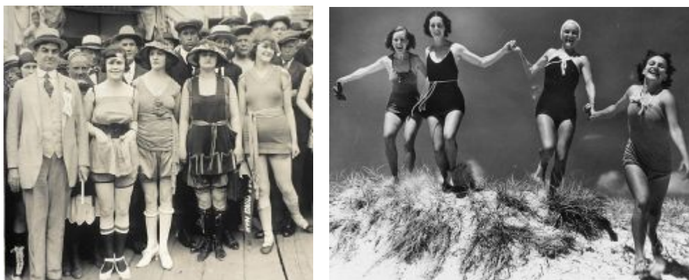
Рис. 3. Одяг для купання 1910-1920-х років

Не зважаючи на те, що новий купальний костюм викликав бурхливий протест у деяких представників суспільства, вже в 1930-ті роки з'явилося нове покоління дизайнерів, які проектували купальні костюми з розрахунку на функціональність, еластичність і простоту. Жінки тепер купалися в суцільних комбінезонах або у високих шортах та скромному бюстгальтері на широких бретельках, які можна було спустити для більш рівного загару (рис. 4). І хоча суворі закриті купальники з короткою спідницею також користувалися популярністю, важливим було те, що жінки вже по іншому сприймали одяг і своє тіло.