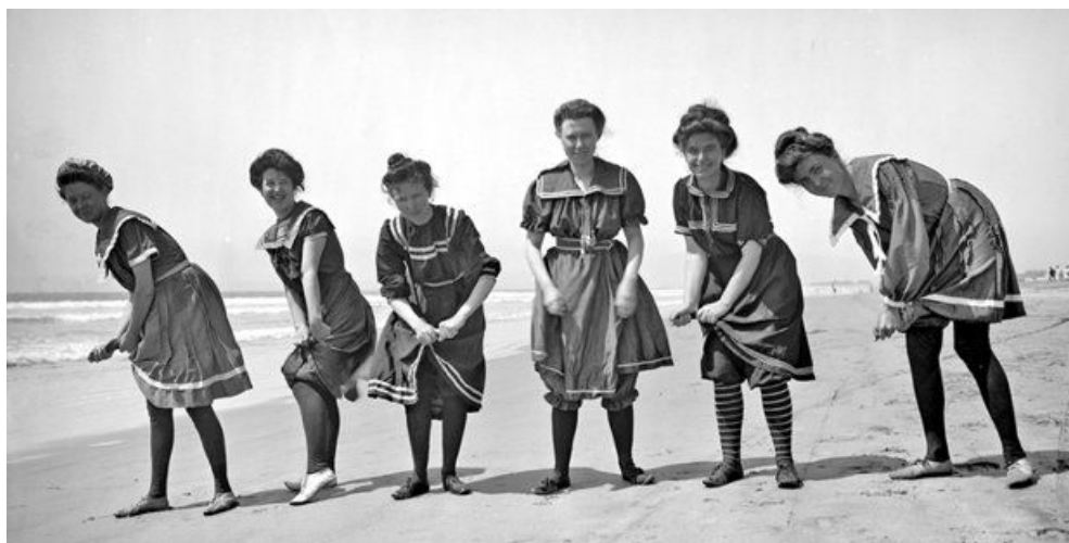
Рис. 2. Купальник зі зшитих разом блузи і широких бавовняних штанів

на шнурованні і головні убори – очіпок або солом'яний капелюшок. Наступний етап еволюції – двоскладні купальні костюми: жакет та довгі панталони, що повністю закривали ноги. Подальші зміни почалися з введенням короткого рукава: спочатку рукав вкоротили до ліктя, потім зовсім відрізали. Змінювалась і довжина штанів: тепер вони повністю відкривали щиколотки і навіть половину ікри. У 1880 році була введена нова модель купального костюма – «принцеса», яка складалася зі зшитих разом блузи і широких бавовняних штанів. До нової моделі додавалася окрема спідниця, що спускалась нижче колін і приховувала фігуру (рис. 2).