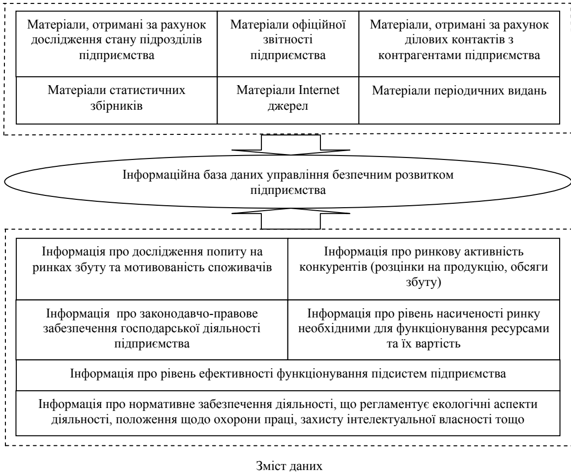
Рис. 3. Джерела інформаційного забезпечення формування бази даних управління економічною безпекою підприємства

Як приклад дослідження стану економічної безпеки підприємства можна представити наступний підхід: формування та розрахунок системи одиничних показників [4], приведення отриманих значень до єдиної системи вимірювання [5], визначення групових та інтегрального показників [6], аналіз подальших тенденцій із застосуванням адаптивної моделі прогнозування, оцінювання рівня ризикованості та ймовірності зміни показника у наступних періодах [7].