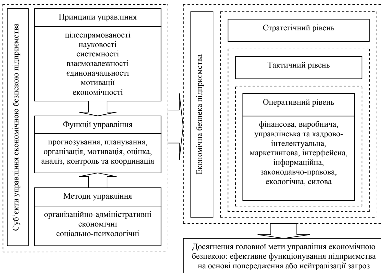
Рис. 2. Принципова модель управління економічною безпекою підприємства

Основні джерела інформаційного забезпечення при створенні бази даних управління економічною безпекою представлено на рис. 3.