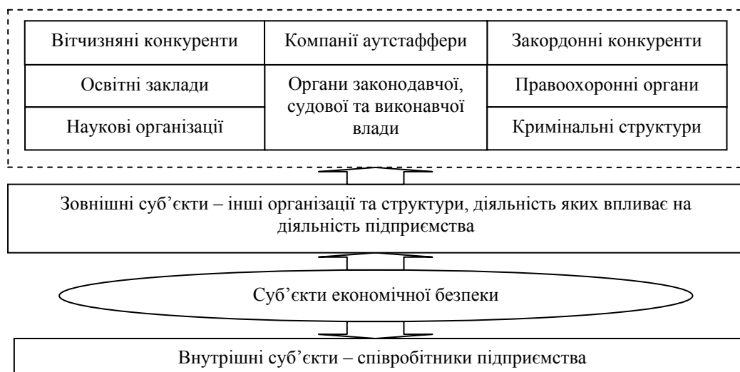
Рис. 1. Суб'єкти управління економічною безпекою підприємства

є впорядкованим набором логічно пов'язаних даних, призначених для дослідження стану економічної безпеки. Тобто це сукупність інформації, що призначена для прийняття рішень, яка і є інформаційним забезпеченням діяльності підприємства.