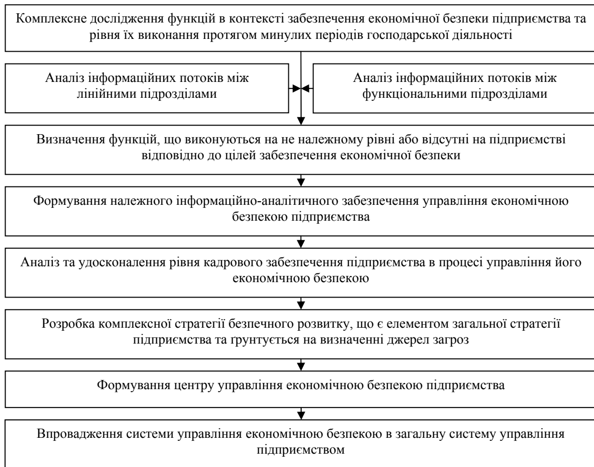
Рис. 4. Процес інтеграції управління економічною безпекою у загальну систему управління підприємством

Оснoву процесу бюджетування становлять бюджети, які представляють собою фінансові плани [8, 9], що охоплюють всі сфери діяльності підприємства, дозволяють визначити всі витрати та можливі результати щодо забезпечення економічної безпеки у певному періоді в цілому та за окремими її складовими зокрема.