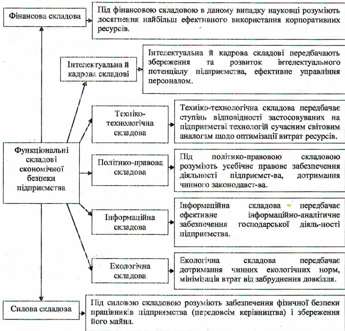
Рис.1 Функціональні складові економічної безпеки підприємства