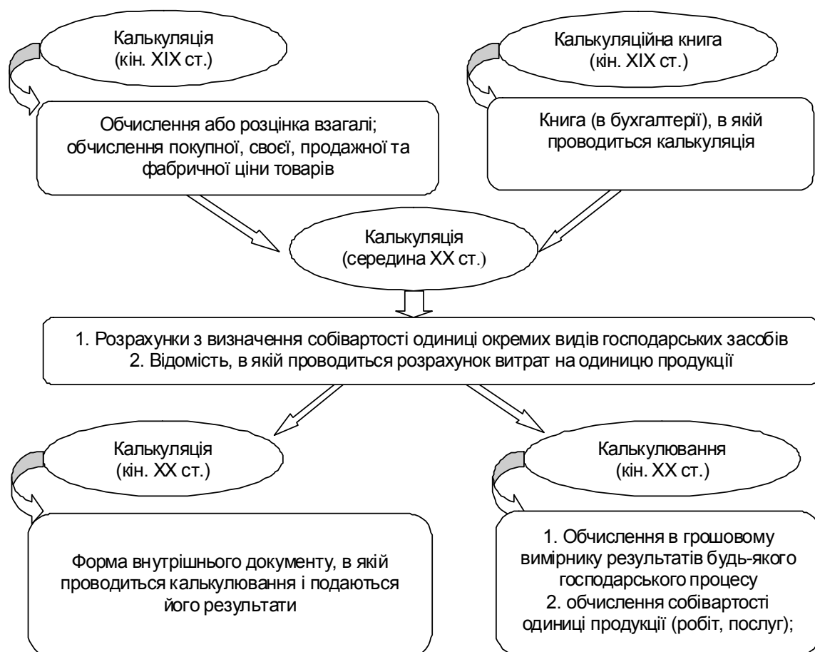
Рис. 3. Еволюція поглядів щодо сутності понять “калькуляція” та “калькулювання”

В ході дослідження було виявлено, що неоднозначність підходів вчених та авторів до трактування понять “калькуляція” та “калькулювання” зумовлена історичними умовами розвитку економічної науки (рис. 3.).