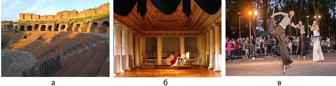
Рис. 1. Візуалізація різних видів театру: а- театр у Беневенто, 27рр. до н.е. (Італія); б –Королівський театр, «Дрюрі Лейн», 1768 р. (Велика Британія); в – сучасний вуличний театр (Франція).

Класичний театр було започатковано наприкінці XVI століття у Франції та Італії і розвитку до сучасного рівня сприйняття та масштабу дійства (Рис.1). Однак театр як такий бере початок відліку розвитку у різних країнах по різному і починається він від домашніх театралізованих сімейних постановок до придворних домашніх театрів. В таких театрах була постійна труппа акторів з числа кріпосних, яка належала пану і представляла за його бажанням драматичні та тематично-театралізовані постановки. Згодом після відміни кріпосного права актори стали вільними і утворили незалежні акторські угруповання, які подорожували світом чи працювали осідло в містах і представляли на загал свої професійні вміння. У всі періоди існування театру особливе значення для отримання успіху театральної постановки має костюм, як театральний рушій через який глядач сприймає інформацію [2, 3].