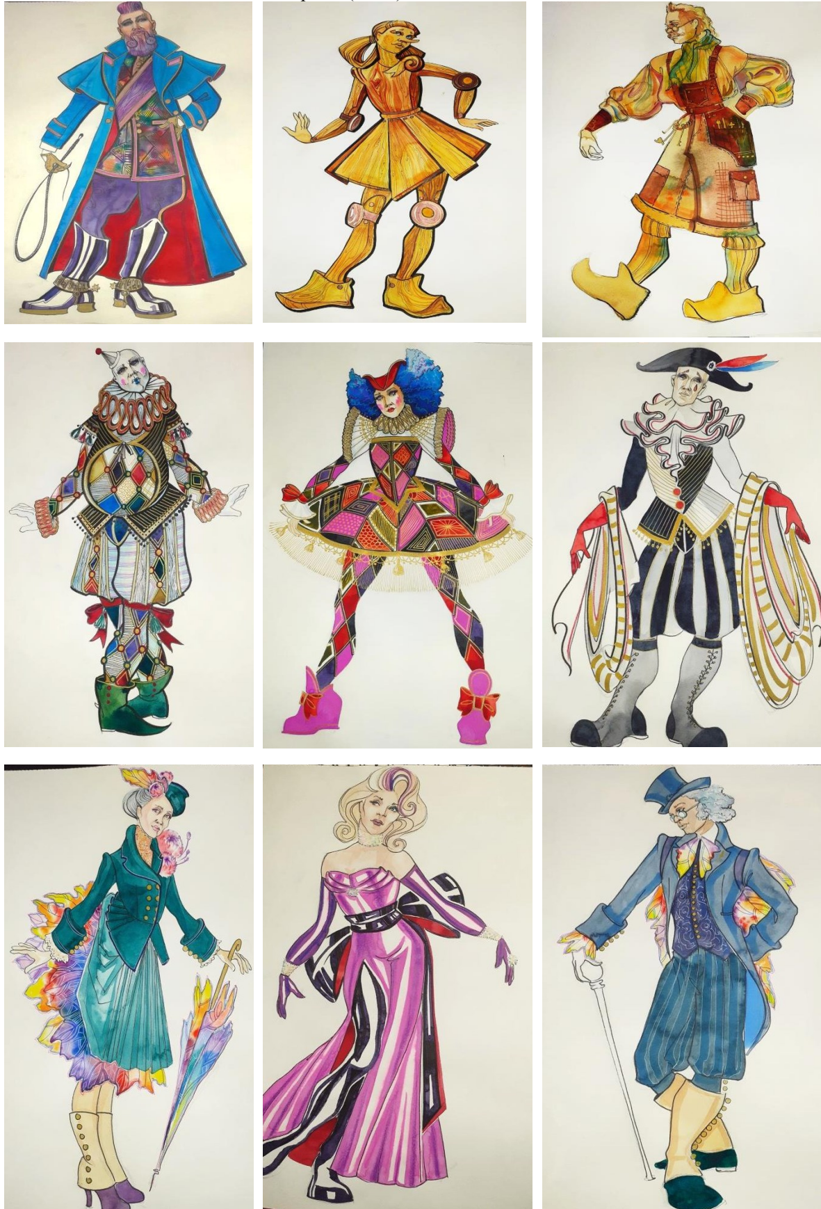
Рис.4. Візуалізація ескізів до проекту «Піноккія»

При розробці ескізів взуття (Рис 4) було враховано думку та ескізи художника по костюмам Дмитра Куряти, опрацьовано книжкові ілюстрації творів Олексія Толстого «Золотий ключик або пригоди Буратіно» та Карло Коллоді «Піноккіо», досліджено теоретично історичні відомості про взуття, та використано власний досвід авторів проекту при розробці конструкцій, підборі матеріалів, виготовленні та оздобленні готових виробів (Рис.3).