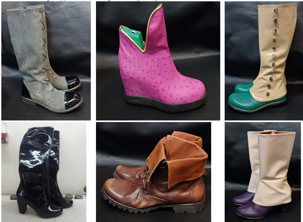
Рис.3. Візуалізація окремих готових виробів проєкту «Пінокія»