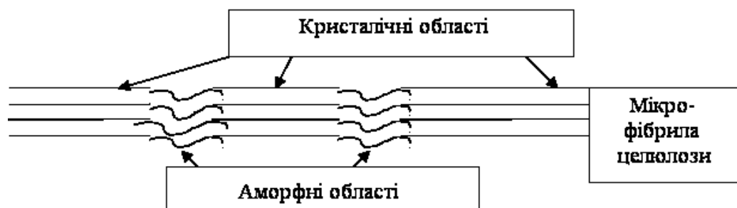
Рис. 2. Схематичне зображення надмолекулярної структури целюлози.

Полімерні ланцюги целюлози упаковані в довгі пучки, або волокна, в яких поряд з упорядкованими, кристалічними є і менш впорядковані, аморфні ділянки (рис. 2). Визначений відсоток ступеню кристалічності залежить від типу целюлози, який за рентгенівськими даними становить від 70% (бавовна) до 30 – 40 % (віскозне волокно).