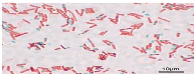
Рис. 2. Бактерії роду Bacillus subtilis

Для очищення стічних вод шкіряного виробництва хромових шкір використовуються бактеріальні препарати [5, 6]. Тому при розробці ефективних технологій відмочувально-зольних процесів перспективними можна вважати бактеріальні препарати, які продукують ферменти різної функціональної дії [7]. Особливий науковий і технологічний інтерес становлять бактерії роду Bacillus , що є найбільш поширеними в природі. Вони відзначаються високою пристосованістю до зовнішніх умов. Зокрема, бактерії виду Bacillus subtilis (рис. 2) як продуценти ферментів, антибіотиків, інсектицидів [8 – 11] характеризуються здатністю існувати за умов відсутності кисню та в широкому діапазоні температур, використовуються для живлення органічних та неорганічних сполук тощо. Про високу деструктивну властивість бактерій роду Bacillus свідчить їх широке застосування в різних технологічних розробках [12 – 15].