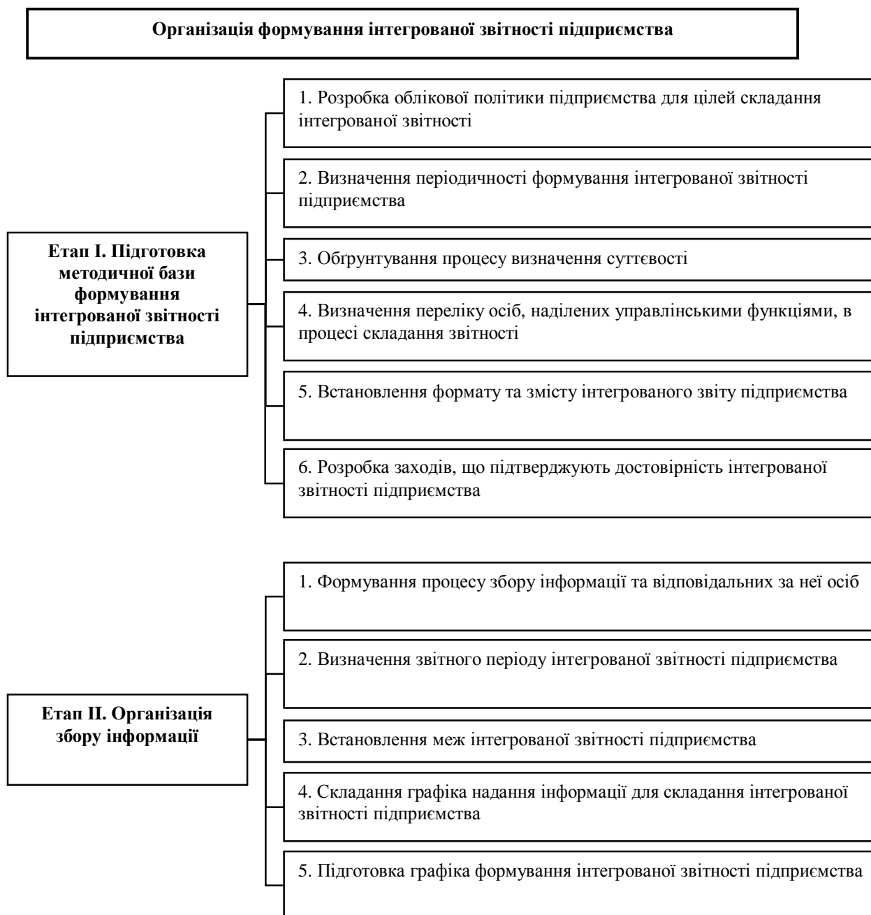
Рис. 1. Схема формування інтегрованої звітності підприємства

Схему формування інтегрованої звітності підприємства наведено на рис. 1.