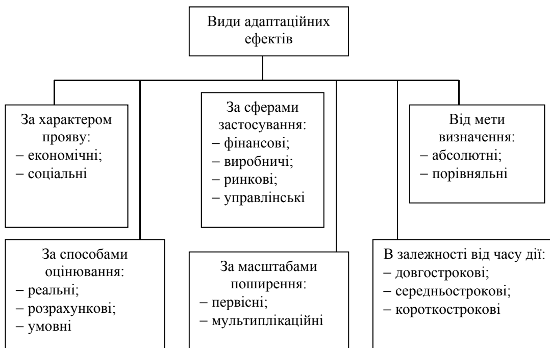
Рис. 1.6. Види адаптаційних ефектів на підприємстві

– соціальні адаптаційні ефекти, виявляються у покращенні умов праці, застосуванні прогресивних форм морального та особистісного стимулювання працівників, вирішенні соціальних проблем, задоволенні потреб суспільства (збільшення кількості робочих місць, розширенні сфер діяльності, підвищенні добробуту працівників, забезпечення охорони здоров'я та соціального захисту працівників).