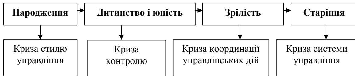
Рис. 1.4. Управлінські кризи на періодах життєвого циклу підприємства 53

залежності від етапів життєвого циклу підприємства виділяють різні види управлінських криз (рис. 1.4).