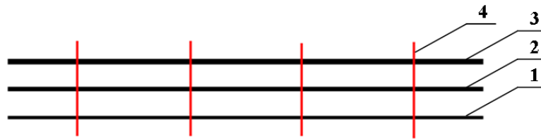
Рис. 2. Схема розташування шарів вкладки для зимового сезону:

1 – наномодифікована тканина для пригнічування та зменшення мікробного середовища; 2 – трикотажне полотно CoolMax для перерозподілу вологи на поверхні текстильного матеріалу; 3 – вовняна тканина для надання теплозахисних властивостей; 4 – наномодифіковані поліпропіленові нитки