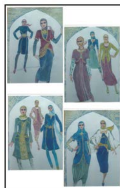
Рис. 4 Разработка ассортиментных рядов моделей на основе национальных и этнохудожественных традиций Ирана