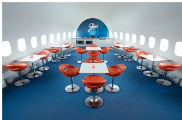
Рис. 6. Споріднено-контрастні кольори