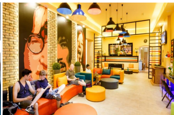
Рис. 7. Багатобарвні кольори