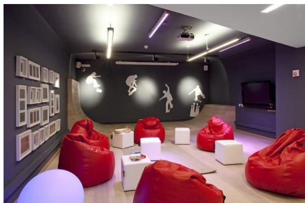
Рис. 5. Нейтральні кольори з яскравим акцентом