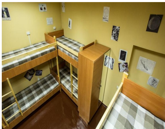
Рис. 1. Хостел Хосмос, Україна, м. Харків