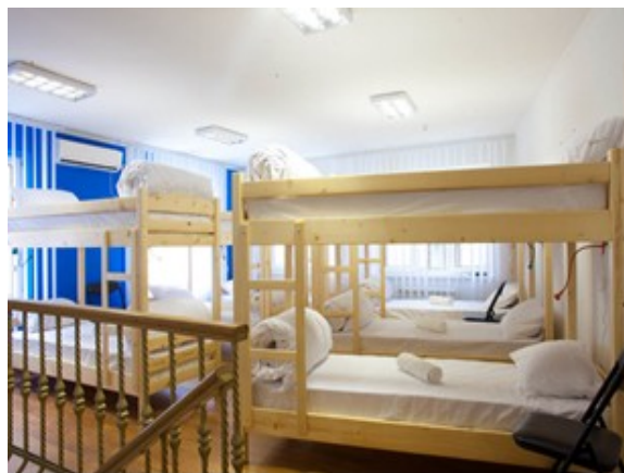
Рис. 2. Yard Hostel & Coffee Shop, м. Чернівці