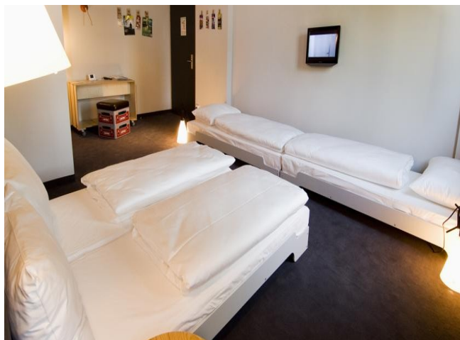
Рис. 3. Superbude Hotel Hostel St.Pauli, Німеччина, м. Гамбург

Також необхідно приділити увагу різним аспектам розвитку хостелу, в тому числі і інтер'єру. Сучасний дизайн готелів передбачає обов'язкове врахування багатьох факторів. Необхідний правильний підбір меблів, декору, оздоблювальних матеріалів, відповідно до рівня комфортності засобу розміщення.