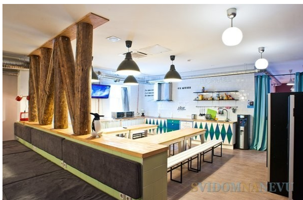
Рис. 4. Природні кольори