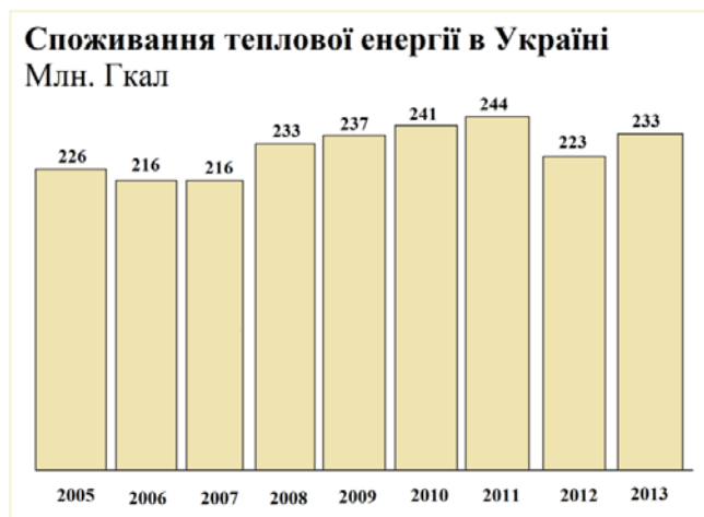
Рис. 2 Споживання теплової енергії в Україні

Загальний виробіток теплової енергії ТЕЦ, котельнями різного призначення, індивідуальними генераторами тепла та іншим джерелами складає порядку 230-240млн.Гкал на рік. Основними споживачами теплової енергії є житлово-комунальний сектор (44%) і промисловість (35%); інші галузі економіки разом споживають близько 21% тепла [1] (Рис.2).