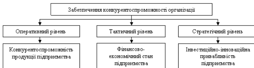
Рис. 2. Рівні забезпечення конкурентоспроможності підприємства

Основні рівні забезпечення конкурентоспроможності підприємства представлено на рис. 2.