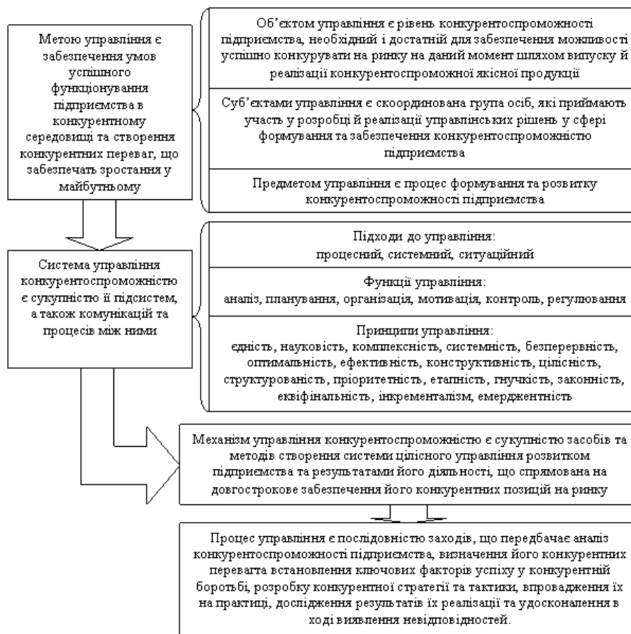
Рис. 3. Модель забезпечення конкурентоспроможності підприємства

На основі зазначеного, представимо на рис. 3 модель забезпечення конкурентоспроможності підприємства.