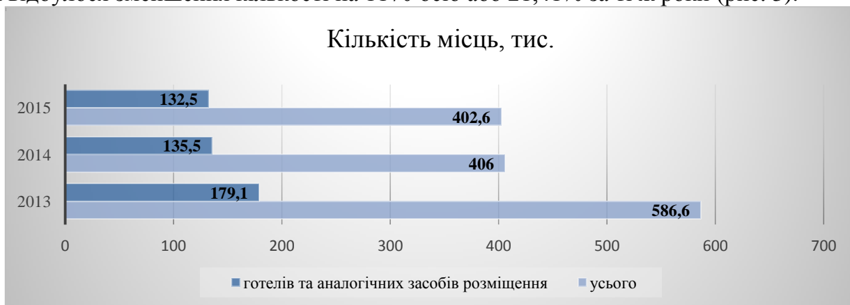
Рис. 2. Кількість місць для розміщення в готелях та аналогічних засобах розміщення за 2013-2015 рр.

Проаналізована динаміка кількості розміщених в готелях та аналогічних засобах розміщення за 2013-2015 роки показала скорочення усього розміщених на 2523 особи (30,3%) в 2015 році в порівнянні з 2013р. В готелях та аналогічних засобах розміщення також відбулося зменшення кількості на 1170 осіб або 21,41% за ті ж роки (рис. 3).