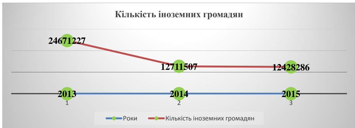
Рис. 5. Кількість іноземних громадян, які відвідали Україну

Кількість іноземних громадян, які відвідали Україну в 2015 році скоротилась на 283 221 особу або на 2,23%, в порівнянні з 2014 роком, та 12 242 941 осіб (49,62%) в порівнянні з 2013 роком (рис.5).