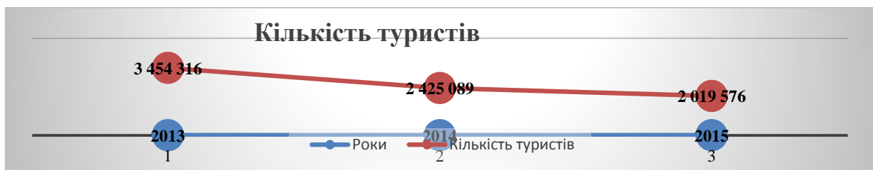
Рис. 4. Кількість туристів, які обслуговувались суб'єктами туристичної діяльності України

В загальному, по країні динаміка туристичних потоків має тенденцію до зменшення за 2013-2015 рр.. Кількість туристів, які обслуговувались суб'єктами туристичної діяльності України скоротилась за 2015 рік на 405 513 осіб або на 16,72% в порівнянні з 2014 роком, та на 1 434 740 осіб, що в відсотковому відношенні становить 41,53% в порівнянні з 2013 роком (рис.4).