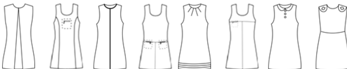
Рисунок 2 – Типові конструктивні рішення сучасних сарафанів, яким надають перевагу дівчата молодшої шкільної групи та їх батьки