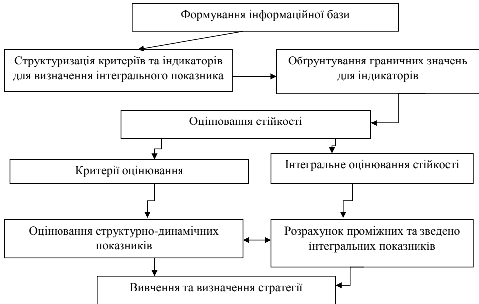
Рис. 2. Методичні основи розрахунку інтегрального показника