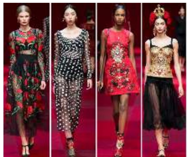
Рис. 3, 4. Колекція Dolce&Gabbana (сезон весна-літо 2015)