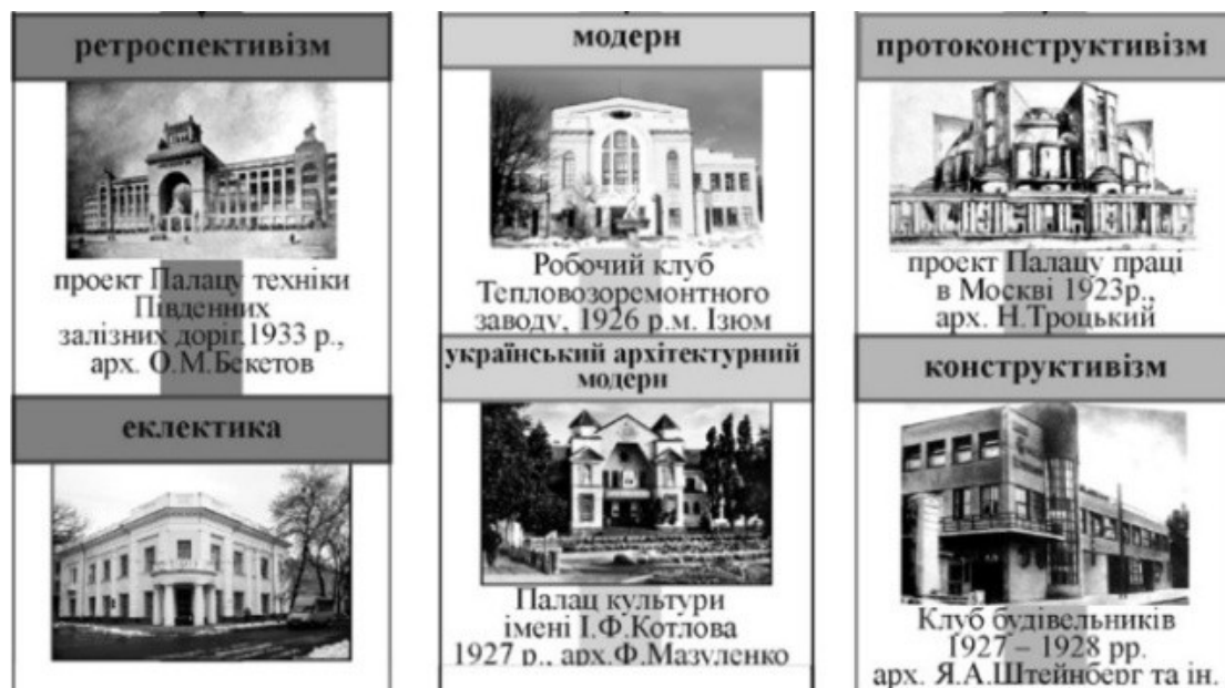
Рис. 1. Стильові напрями вирішення клубних будівель 1920-і – I половина 1930-их рр.

На першому етапі (рис. 1) розвитку клубного будівництва (1920-і – I половина 1930-их рр.) відбувається проектування і зведення клубних будівель у ретроспективному, синтетичному та раціоналістичному стильових напрямках, що доводить принцип паралельного співіснування декількох стилів при домінуванні одного з них. Основним на даному етапі був раціоналістичний напрям, на формотворення якого були покладені функціональний та конструктивний методи з простотою та лаконізмом форм.