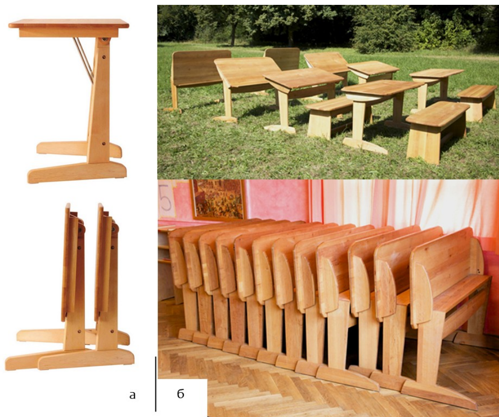
Рис. 6. Складані учнівські столи:

а) Hoeller Massivholzmoebel; б) Schreinerei Andreas Eberwein