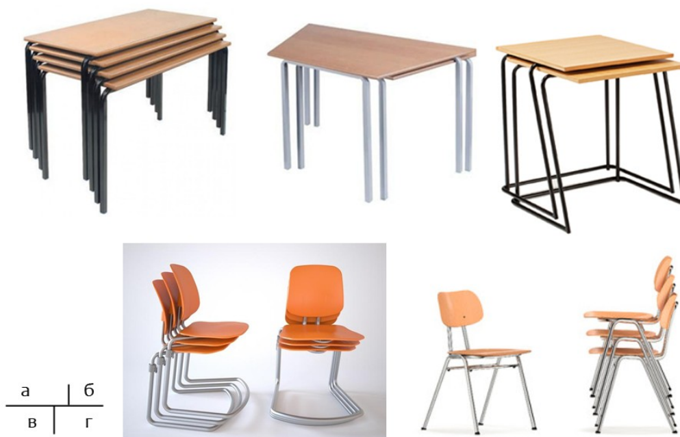
Рис. 5. Учнівські столи та стільці з можливістю штаблювання без зміни геометрії: а) Educational Furniture; б) Alpha Furniture; в) Perch Studio; г) Vereinigte Spezialmöbelfabriken

Використання учнівських столів та стільців, що дозволяють штаблювання та пакетування, дає змогу збільшити вільну площу приміщення для різних видів діяльності. На сьогодні пропозиції подібних меблів розвиваються у декількох напрямках. По-перше, існують моделі як стільців, так і столів, що можуть укладатись у більш-менш компактні пакети без зміни геометрії самих виробів (рис. 5). По-друге, є пропозиції складаних учнівських меблів, що дозволяють ще більш компактне складування за рахунок зміни положення окремих елементів виробу (рис. 6).