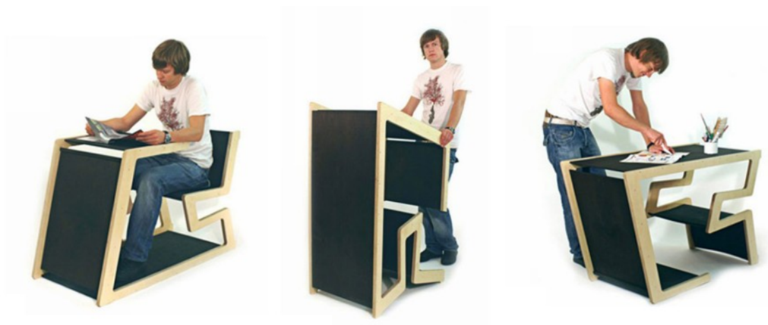
Рис. 3. Парта-перекидень Esobank, дизайнер Marius Goetze