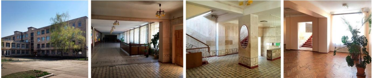
Рис. 2. Середня загальноосвітня школа в м. Києві

З метою уточнення системи критеріїв, з'ясування можливості за допомогою цієї системи виявляти переваги та недоліки того чи іншого інтер'єрного рішення, надавати рекомендації щодо вдосконалення середовища навчального закладу було здійснено комплексний аналіз предметно-просторового середовища середньої загальноосвітньої школи в м. Києві (рис. 3), що досі зберігає основні риси типових шкільних будівель радянського періоду. Цю будівлю було досліджено шляхом спостереження, співбесід з учнями та вчителями, фотофіксації та часткових обмірів.