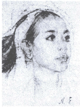
М. Фешин «Дівчинка з острова Балі»

Прикладом конкретних, безпосередньо емоційних взаємин між художником і життям є портретний рисунок П. Басанця «Фуражист Іван», де яскраво виявляється психологічний зв'язок художника з натурою.