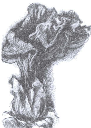
А. Чебикін «Суха квітка»

По суті, вміння компоувати визначає вміння творчо мислити. Без перебільшення можна говорити про композицію як про фундамент для будь-якого твору. Вона узагальнює життєві спостереження і підпорядковує їх творчим цілям художника.