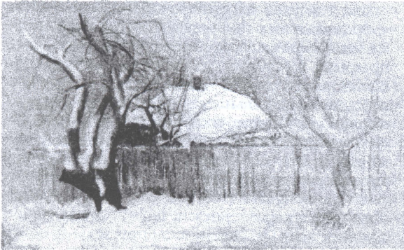
П. Басанець «Зимовий мотив»

Для того, щоб зображення стало переконливим, необхідне чуття відбору та уява. На прикладі роботи «Стара хата» В. Колеснікова можна відзначити, що станковий пейзаж у рисунку має власні образні властивості. До основних ми відносимо прагнення до філософського узагальнення конкретних вражень. Головним результатом такого узагальнення стає виявлення характеру міркувань, роздумів художника про світ, про природу прекрасного. При конкретному аналізі пейзажних рисунків легко переконатися, що ці проблеми ставляться і зважуються на основі зображення лише конкретних мотивів і обставин природи.