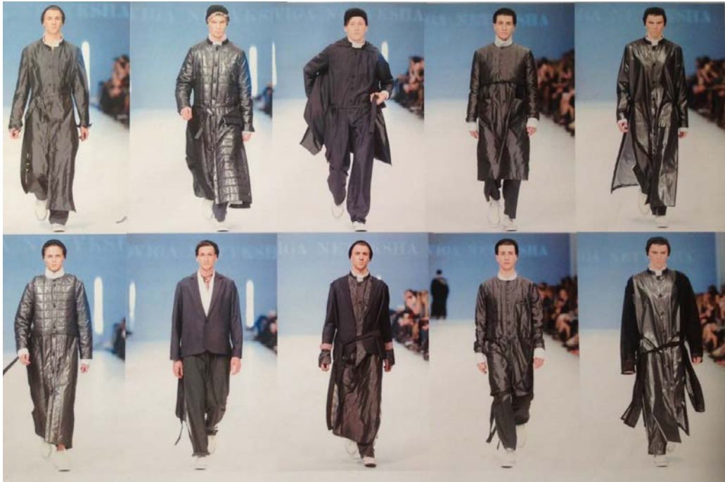
Рис. 5. Колекція чоловічого одягу за мотивами стилістики 1990-х років ХХ ст., представлена на показі UkrainianFashionWeek 2016

Висновки. Мода, як дзеркало, відображає світ та соціальні явища в суспільстві. Відчувається прагнення поєднання комфорту та функціональності в одязі, відзначається підвищений інтерес до індивідуального самовираження. Інтерпретація стилістичних образів 1990-х років ХХ ст. в художньому проектуванні модного гардеробу для чоловіків є затребуваною та відповідає вимогам сучасного споживача.