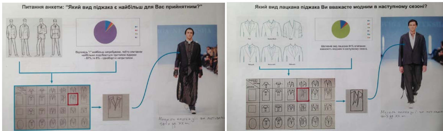
Рис. 3. Алгоритм художнього проектування одягу на основі дослідження композиційних особливостей костюма та стилю 1990-х років ХХ ст.

аналізу здійснено розбір костюма 90-х років ХХ ст. на складові структурні елементи, досліджено їх співвідношення та організацію у загальній формі. Здійснено морфологічний аналіз та подальший синтез елементів форми костюма, з метою виявлення найбільш вдалих комбінацій (рис. 3).