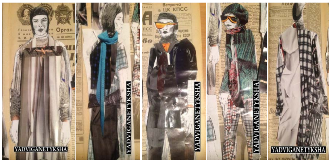
Рис. 4. Ескізи колекції чоловічого одягу на основі дослідження композиційних особливостей костюма та стилю 1990-х років ХХ ст.

Враховуючі отримані результати досліджень та побажання споживачів, розроблено колекцію одягу для чоловіків з урахуванням особливостей художньо-композиційного рішення чоловічого одягу 1990-х років ХХ ст.. Проектована колекція позиціонується як «елегантний спорт». Характеризується поєднанням функціональності з елегантністю та стриманістю (рис. 4, 5).