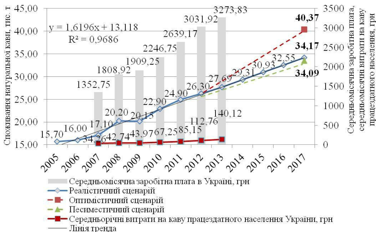
Рис. 2. Сценарії розвитку споживання натуральної кави в Україні

Добробут суспільства відіграє значну роль, якщо йдеться про обсяги попиту на ринку. Однак зміни на ринку внаслідок цінових коливань та курсу валют, а також унаслідок прийняття тих чи інших рішень країнами виробниками або споживачами щодо лібералізації або ж, навпаки, протекціонізму внутрішнього ринку, також суттєво впливають на його рівень. У статті нами оцінено існуючий вплив ринку кави на зміни доходів держави, обсяги виробничого і споживчого надлишків та зміни у виробництві й споживанні, що в сукупності дало змогу розрахувати загальний економічний ефект від функціонування ринку кави в Україні (табл. 2).